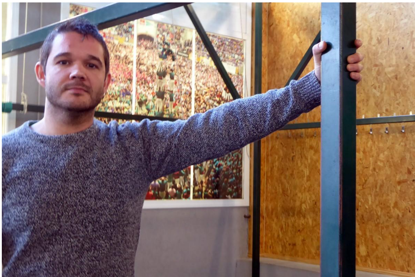
El local dels assajos amb els alumnes de Sabadell

- Per dir-ho d'alguna manera, seria el nostre territori de comoditat. Fa uns anys vam començar a fer actuacions de barri com ara a les Termes, Can Puiggener i d'altres. I gràcies aquest projecte fet el 2018, ara quan fem aquests tallers a les escoles ja ens coneixen, encara que sigui per les activitats del bàsquet. Però ens ha servit per estendre una mica més aquesta cultura castellera per la ciutat.